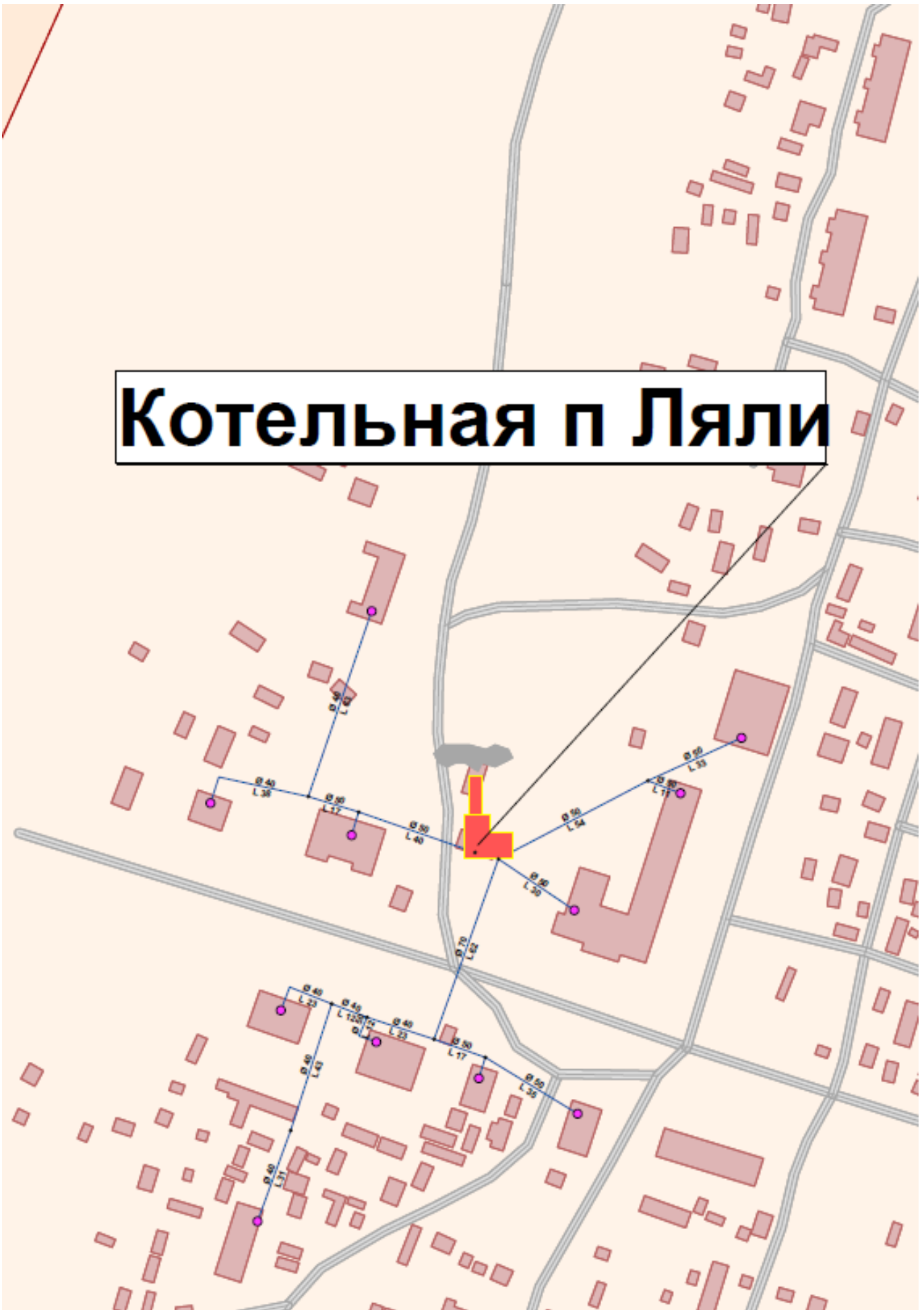
Рисунок 2.2 – Зона действия котельной «Ляли»