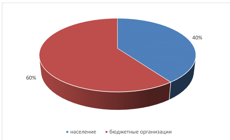
Рисунок 3.3 – Прогнозный структурный баланс водоснабжения