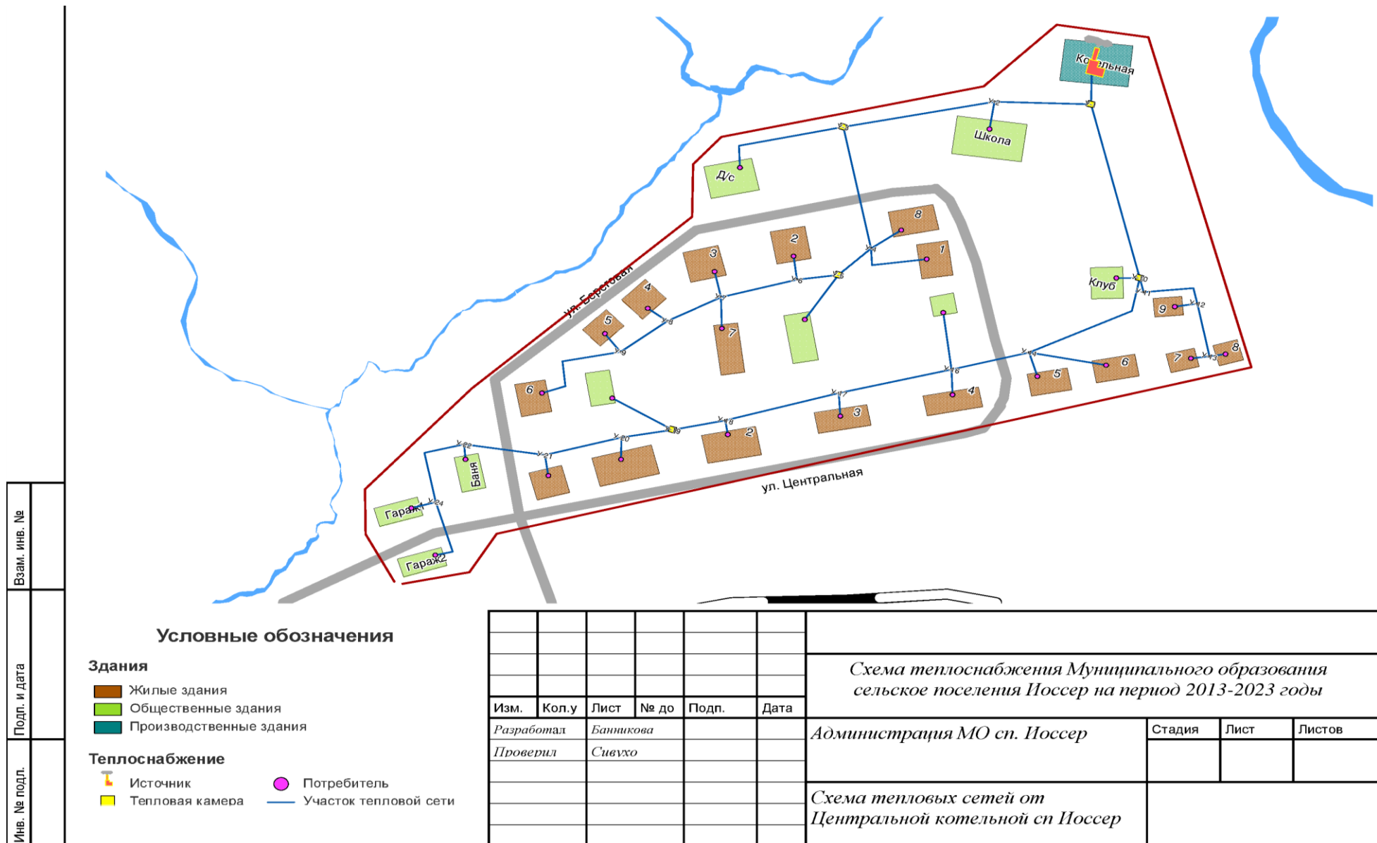
Рисунок 2.1 – Зона действия центральной котельной.